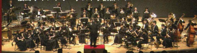
ゲスト: はつかいちジュニア弦楽合奏団 "NO・ZO・MI"